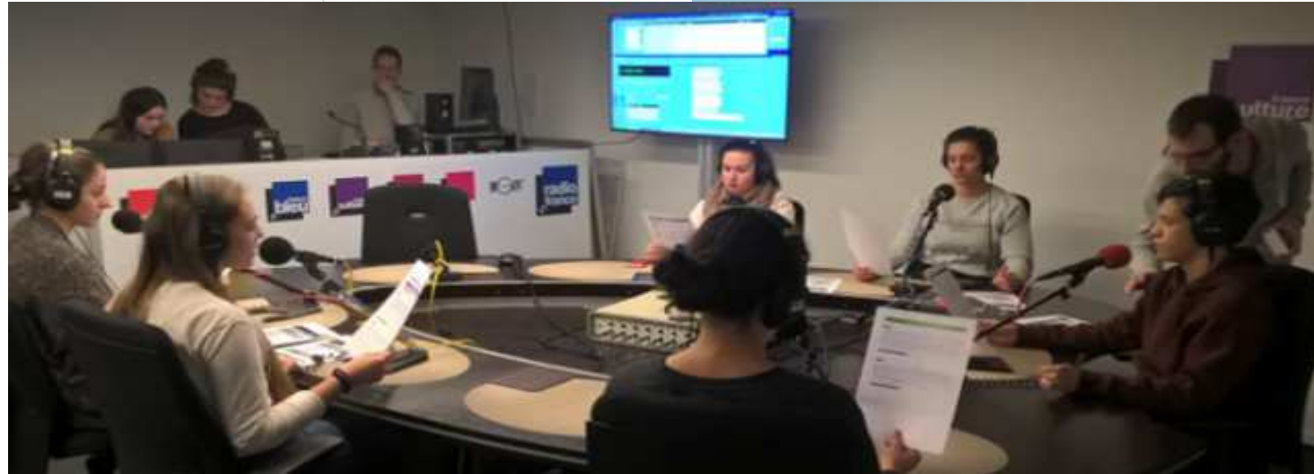
Elèves préparant une émission enregistrée le jeudi 5 janvier 2017, à la maison de la Radio à Paris, aidés par des techniciens de France info. http://lyc58-pierregillesdegennes.ac-dijon.fr/spip.php?article162#162

Une sortie est prévue à la maison de la radio pour permettre une découverte de ce média et des métiers qui y sont liés.