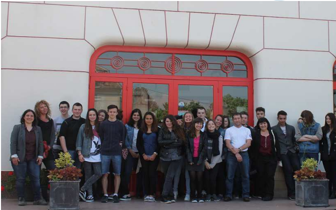
Classe de 2nde 4 ayant participé au prix Jean Renoir en 2014-2015 devant l'Eden.

Si cette candidature n'est pas retenue, un concours sera organisé au sein du lycée.