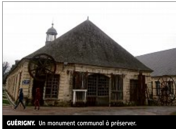
GUÉRIGNY. Un monument communal à préserver.

Le bâtiment à clocheton date de 1823. Situé à Guérigny, sur le site des Forges Royales, vers le bief, il est classé aux Monuments historiques.