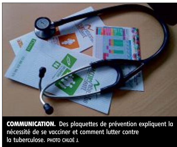
COMMUNICATION. Des plaquettes de prévention expliquent la nécessité de se vacciner et comment lutter contre la tuberculose.

Les deux infirmières se déplacent sur cinq sites répartis dans toute la Nièvre (Château-Chinon,